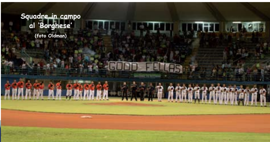
Squadre in campo al 'Borghese'

di consegnare la pallina a Enorbel: qualche brivido al 7° e poi finale in straordinario crescendo (5 "k" e 0 pgl). Il box neroarancio si accende a intermittenza ma sono bagliori che accecano i pitcher laziali. Chiarini, Gomez (perfetto batti e corri) e Spinelli (sempre puntuale) fanno pari al 2° su Antonio Romero poi al 5° scatta la vecchia regola del baseball. Due out e basi vuote: Bertagnon strappa il "walk", Buccheri tiene acceso l'inning e Zileri batte il sorpasso, con Santora e Romero che battono il ferro finchè è caldo (1-4). Nettuno reagisce, ci mancherebbe, e al 7° il gioco si ferma per una dubbia interpretazio-